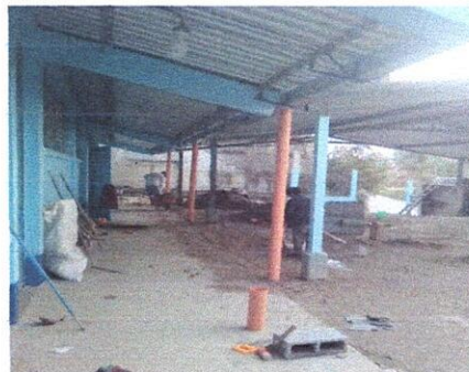
Foto 10: Trabajo durante la sustitucion de bajada de agua plubial